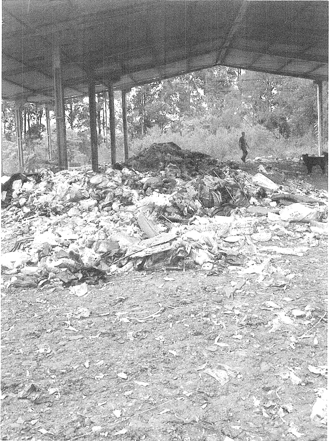
Figura 01: Materiais a serem removidos.